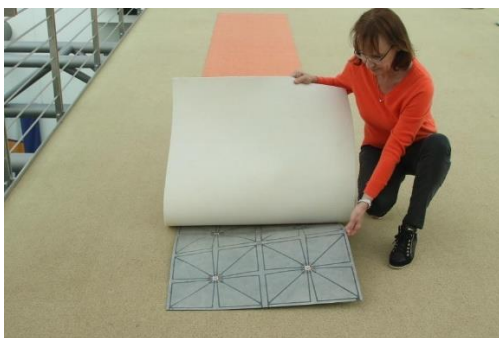
SensFloor® Gait als mobile Lösung

SensFloor® Gait gibt es fest im Boden installiert, oder als mobile Lösung. Beide Varianten sind im Vergleich zu anderen Methoden weniger aufwändig und deutlich günstiger.