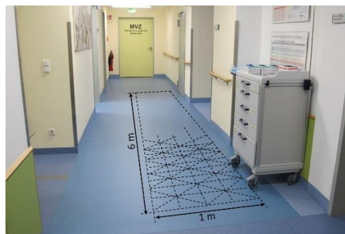
SensFloor® Gait festinstalliert im Klinikum Frankfurt Oder